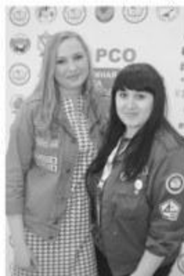
боец ССО «Рубин».

В окружной школе принимали участие более 230 представителей студенческих отрядов из 49 вузов Сибири, представители Свердловской, Челябинской, Самарской, Тюменской, Тульской областей и города Москвы.